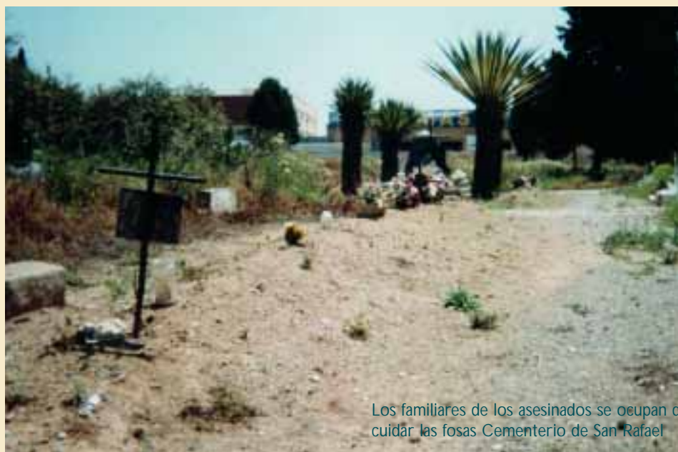
Los familiares de los asesinados se ocupan de cuidar las fosas Cementerio de San Rafael

Aún faltan datos de comarcas enteras, como Ronda y Antequera, y de la mayoría de municipios de la provincia. Por otra parte, en el municipio granadino de Órgiva se tiene constancia de un enterramiento colectivo con no menos de 2.000 cadáveres, en los que algunos testimonios señalan que este lugar fue la tumba de numerosos malagueños que trataban de llegar a Almería tras la caída de la ciudad. Ante la magnitud del trabajo, este colectivo ha mantenido conversaciones con profesores de la Universidad para promover la formación de un grupo de trabajo técnico para asegurar que tanto la exhumación e identificación de los restos, como la